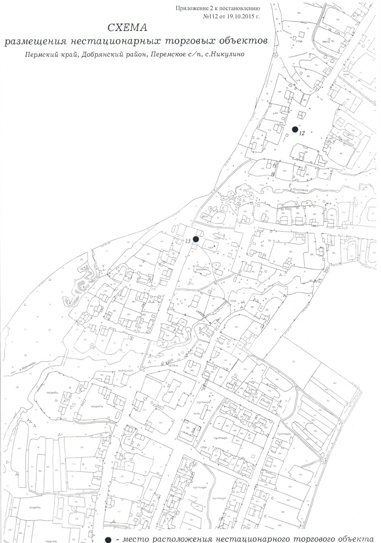
СХЕМА размещения нестационарных торговых объектов Пермский край, Добрянский район, Перемское с/п, с.Никулино

● - место расположения нестационарного торгового объекта